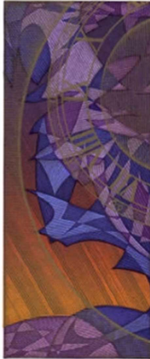
Рис. 7. Пугачевський Г. «Час». Х6. 1999 р.