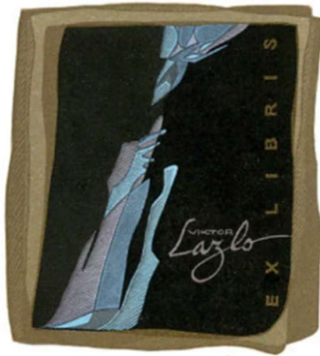
Рис. 3. Пугачевський Г. «Світло та темрява». Ex libris Viktor Laslo. X6/5. 1993 р.