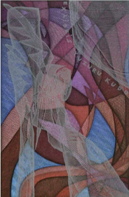
Рис. 4. Пугачевський Г. «Срібний янгол». Ex libris Viktor Laslo. Х6/5. 1993 р.

відмітити, що особливо вдалі свої композиційні та колористичні знахідки автор може варіювати, створювати майже копії сюжетів вільних гравюр в екслібрисах чи навпаки. Інколи це один і той самий аркуш, але з присвятою власнику. Так сталося, наприклад, з мотивом срібного сну («Срібний сон», Х6, 1999 р.), який в екслібрисі перетворений на мотив срібного янгола («Срібний янгол», екслібрис Yuzuru Kudo, рис. 4). Аркуш надрукований у 9 (!) кольорів, мерехтить срібним мереживом тонкої прозорої сітки ліній, накладених поверх кольорових плям. До речі, мотив янгола є одним з найулюбленіших у митця, він варіюється в багатьох роботах [3].