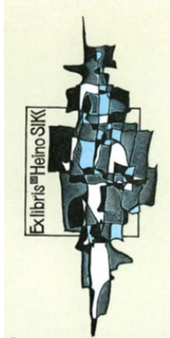
Рис. 2. Пугачевський Г. Ex libris Heino Sikk. Х6/3. 1992 р.