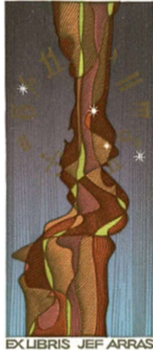
Рис. 5. Пугачевський Г. «Музика та історія». Ex libris Jeff Arras. Х6/7. 1994 р.