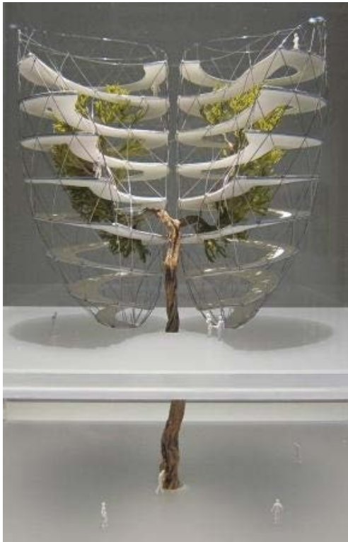
Іл. 2. Ярослав Козакевич, Кисневі вежі, 2005 р., архітектурна модель, пластик, масштаб 1:100

Його наступна концепція – «Анатомія космосу», започаткована у 2012 році, розвиває і доповнює уявлення про «геометрію інтер'єру». Тут Я. Козакевича вже цікавить не тільки архітектура людського тіла, а людина як соціальна істота, що перебуває в русі, взаємодіє з іншими, «олюднює простір».