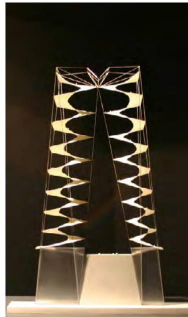
Іл. 1б. Ярослав Козакевич, Вежа кохання, 2004, Модель: пластик, сталь, масштаб 1:400