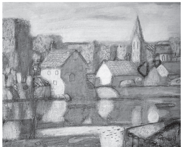
Ил. 2. Ю. Рубашов. Темза. Пастель, авторська техніка. 2000

Прагнення до розкриття нових ідей та творчі пошуки самовираження й оновлення підходів відображення дійсності сприяли появі нових технічних засобів художньої виразності, що спонукало митця до стильових і сюжетних змін. Митець намагається уникати однозначності, навколишнє трансформує через власну особистість у нову художню форму. В процесі формування авторської техніки він обирає шлях новаторства й експерименту, що обумовлює своєрідне трактування різних технічних засобів — поєднання різноманітних за своєю природою матеріалів і технологій. Художник використовує різнокольорові пігменти, олійну пастель, акварельні та акрилові фарби тощо, змішуючи усе з різними розчинниками, що дозволяє оригінально проявити і кристалізувати своєрідний, притаманний йому стиль.