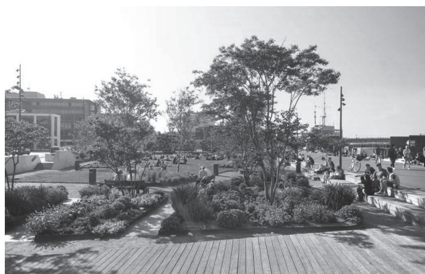
Іл. 3. Порт Ольборга у Данії (Aalborg Waterfront. moool )

Фостера Foster & Partners запропонувало закрити для проїзду північну частину кільця і з'єднати Трафальгарську площу з будівлею Національної галереї, об'єднавши їх у пішохідну зону. Відкриття площі відбулось у 2003 році (іл. 1).