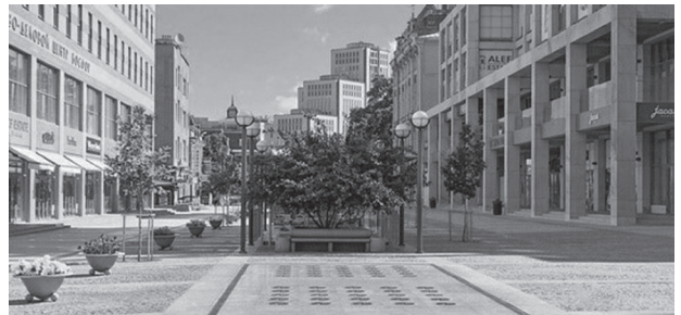
Іл. 6. Катеринославський бульвар у місті Дніпрі (Екатеринославский бульвар. Planet of hotels )

Такий поділ публічного соціального простору необхідний не тільки для задоволення потреб населення, а й для формування і розвитку їх, оскільки потреби та інтереси різних соціальних груп мають суттєві відмінності. Основна мета створення інтерактивних рекреаційних відпочинкових зон полягає в пошуку компромісу та балансу між цими групами для комфортного спілкування їх.