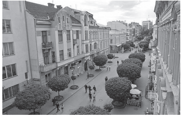
Іл. 5. Вулиця Незалежності в Івано-Франківську (Достопримечательности Ивано-Франковска. Life Journey club )

відкрито восени 2004 року. Він став місцем інтерактивної рекреації та місцем зустрічей, відпочинку, розваг городян і гостей міста, адже проходить через центр Дніпра, на ньому розташовані найбільші торговельні комплекси. Катеринославський бульвар — унікальна пішохідна вулиця в сучасному стилі. Влітку, щойно температура повітря сягне вище 30 градусів, тут вмикаються вуличні охолоджувачі, які розпилюють воду, охолоджуючи повітря до комфортної температури (іл. 6).