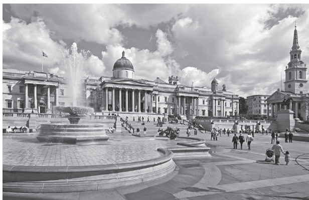
Іл. 1. Трафальгарська площа у Лондоні (Trafalgar Square, London. Wikipedia )

Одним з найяскравіших перетворень площі, оточеної автомобільним рухом, є Трафальгарська площа у Лондоні. У 1990-х роках вона була “охоплена” автомобільним потоком. Пішоходи могли дістатися до неї лише через підземні переходи. У 1996 році архітектурне бюро Нормана