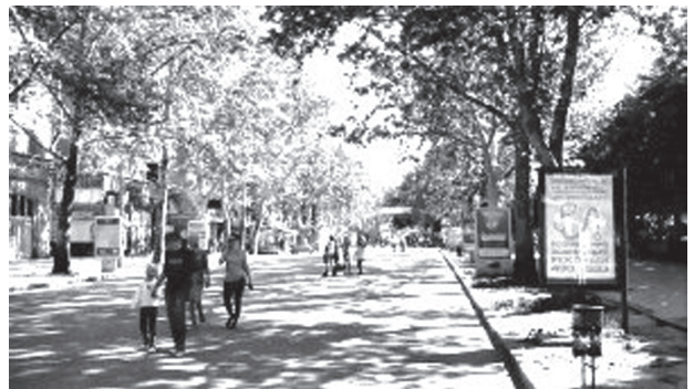
Іл. 7. Вулиця Соборна у місті Миколаєві (Соборна вулиця (Миколаїв). Wikipedia )

Головні висновки. Ефективність міських територій визначається швидкістю реагування їхньої реорганізації на зміни у зовнішньому середовищі та адаптації до них. Нині в центрах історичних міст (як вітчизняних, так і закордонних) катастрофічно не вистачає публічних просторів для широкого спектру відпочинкових функцій. Створення інтерактивної рекреації у структурі історично складеної забудови міста здатне вирішити цю проблему. Така рекреація