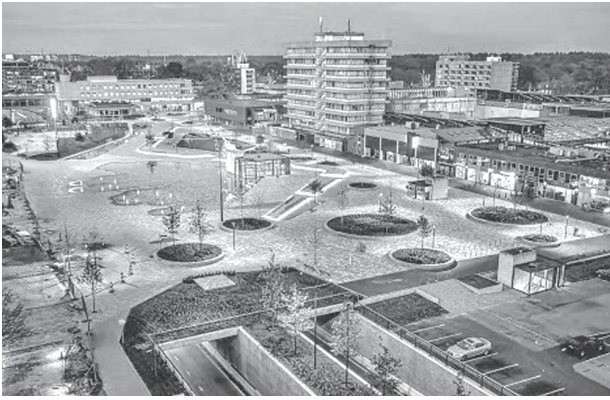
Іл. 4. Центр міста Еммен в Нідерландах (10 лучших общественных пространств. Livejournal )