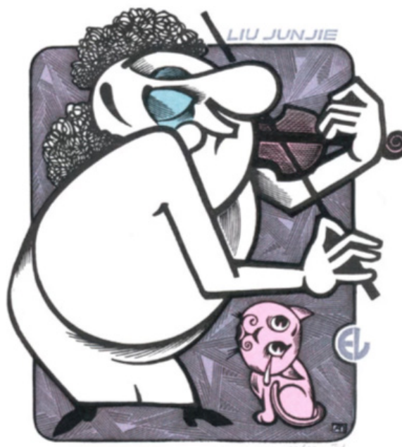
Рис. 7. Пугачевский А. «Скрипач» (цикл «Музыканты»). Цветная гравюра. 2020 г.

Liu Junjie, «Скрипач», цветная гравюра, 2020 г., рис. 7).