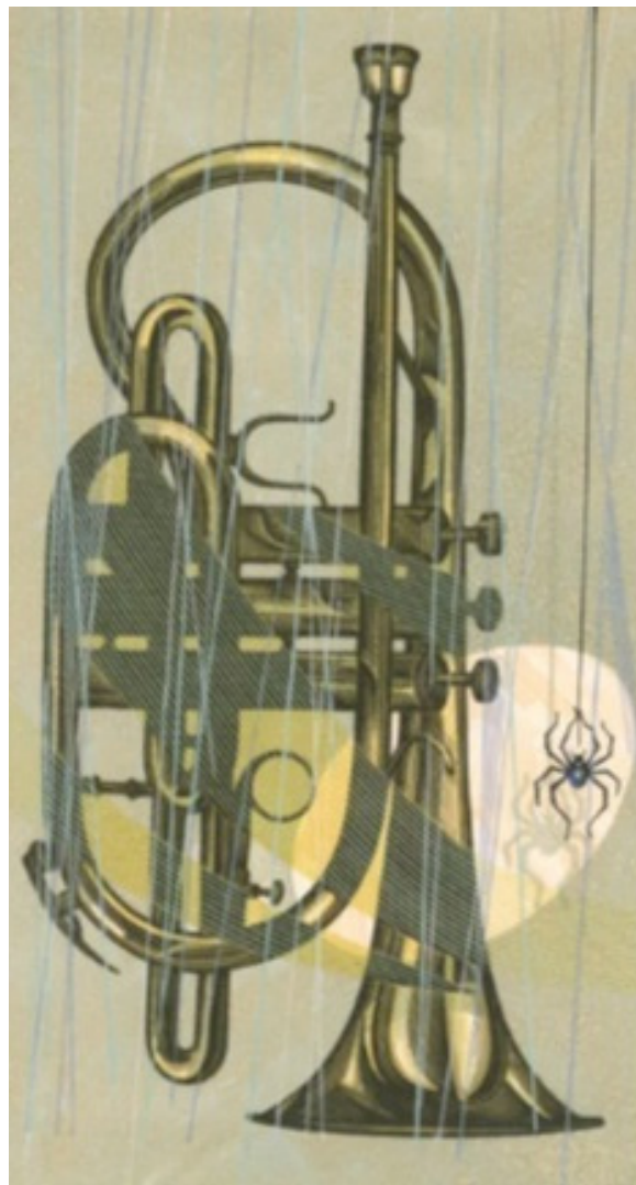
Рис. 6. Пугачевский А. «Тишина». Цветная гравюра. 2003 г.

Небезынтересна и вторая группа работ, хотя в ней гораздо меньше листов. Композиции, в которых музыкальные инструменты являются лишь символом, знаком, отсылкой к скрытому мотиву, это часть аллегии, инструмент ее языка. К такому методу чаще прибегает старший из двух мастеров. «Ностальгия» А. Пугачевского (цветная гравюра, 1996 г.), «Тишина» (цветная гравюра, 2003 г., рис. 6), две версии мотива «Настройщик» (обе – цветная гравюра, 2005 г.), «Каштанка» (цветная гравюра, 2019 г.) – философия знака, символа, звука.