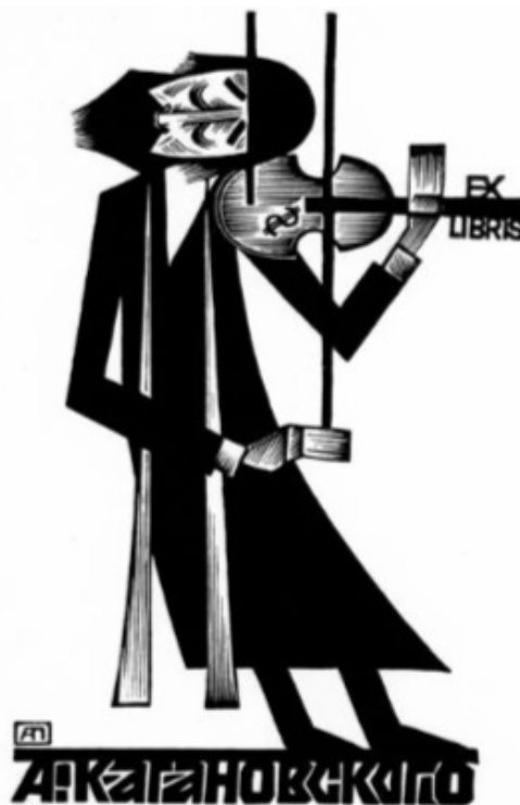
Рис. 1. Пугачевский А. «Еврейский скрипач». Гравюра. 1991 г. Из коллекции Ю. Романенковой.

Синтез трагичного и комичного, философски трактованный, также проводился А. Пугачевским с помощью музыкальных мотивов. Эта философия линии и звука выражена в листах «Все проходит» (цветная гравюра, 1998 г.), «Мелодия для кролика» (цветная гравюра, 2010 г.), «Дуэт» (цветная гравюра, 2014 г.), «Меломан» (цветная гравюра, 2015 г.), «Акордеон» (цветная гравюра, 2019 г.).