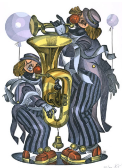
Рис. 4. Пугачевский А. «Дуэт». Цветная гравюра. 2014 г.

Довольно часто в творчестве художника возникал мотив дуэта. В таких композициях всегда воспет контраст силы и слабости, грубости и грации, трагизма и комизма. Нередко подобный мотив контраста выражается при помощи наиболее удачного для этого воплощения – в образах лицедеев («Дуэт», цветная гравюра, рис. 4). Маски веселого и грустного мимов ярче всего воплощают мысль о противоречии и противостоянии извечных двух начал. Лицедеи тоже были среди фаворитов образной галереи обоих мастеров, в первую очередь – Аркадия Пугачевского, который иногда сочетал цирковые мотивы с музыкальной линией [11].