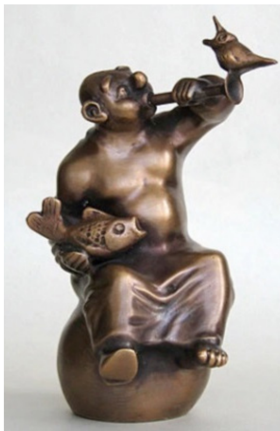
Рис. 3. Пугачевский А. «Трио». Бронза. 2006 г.

Аллегии музыки старший представитель творческой династии воплощал и в мелкой пластике, в бронзе («Трио», бронза, 2006 г., рис. 3).