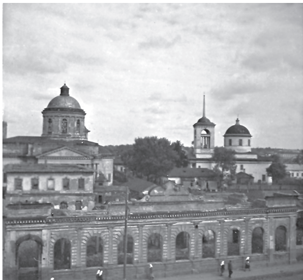
Іл. 3. Залишки міського магістрату. Фото кінця 1950-х років (Зозуля, Морозов 60)

Прикладом реставраційних реконструкцій може слугувати ратуша в Ризі, для відбудови якої був знесений корпус Ризького технічного університету, збудований на місці ратуші. Також до найвідоміших реставраційних реконструкцій належить відбудова Старого Міста у Варшаві, дзвіниці собору Св. Марка у Венеції. Україна також має досвід у цій сфері. На нові обмірних креслень було відбудовано підірваний радянською владою Михайлівський Золотоверхий собор у Києві, а також Успенський собор, храм Різдва Хрестового. Втрачені споруди відновлювали по всій території України, зокрема, Свято-Успенський кафедральний собор у Полтаві, Успенський собор у Володимирі-Волинському, Свято-Василівський собор в Овручі, П'ятницьку церкву в Чернігові тощо. Треба зауважити, що Ніжин має власний досвід реставраційної реконструкції, наприклад, Богоявленська церква, дзвіниця церкви Іоанна Милостивого, дзвіниця Введенського монастиря.