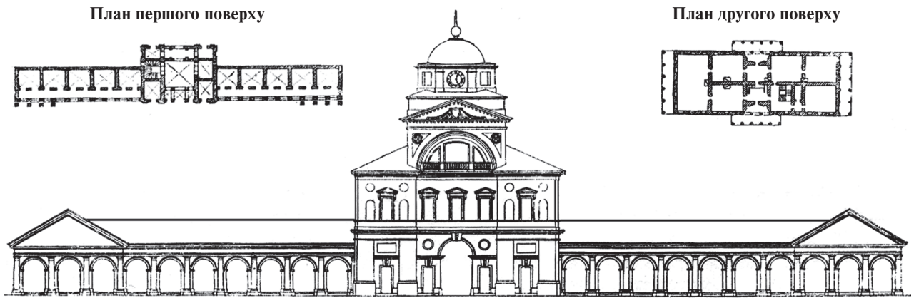
Іл. 1. Будівля магістрату в Ніжині (реконструкція). (Морозов “Ніжинський магістрат”)

мотивом римської ордерної аркади з ризалітами на кінцях, акцентованими трикутними фронтонами. Всі приміщення мали муровані склепіння (іл. 1) (Вечерський 157).