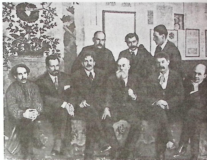
Засновники Української академії мистецтва.

По-новому було визначено структуру навчального закладу, скеровану головним чином на підготовку художників "для гармонійного формування навколишнього середовища, побуту, виробництва".