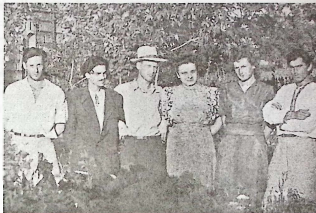
Студенти-випускники скульптурного відділення.