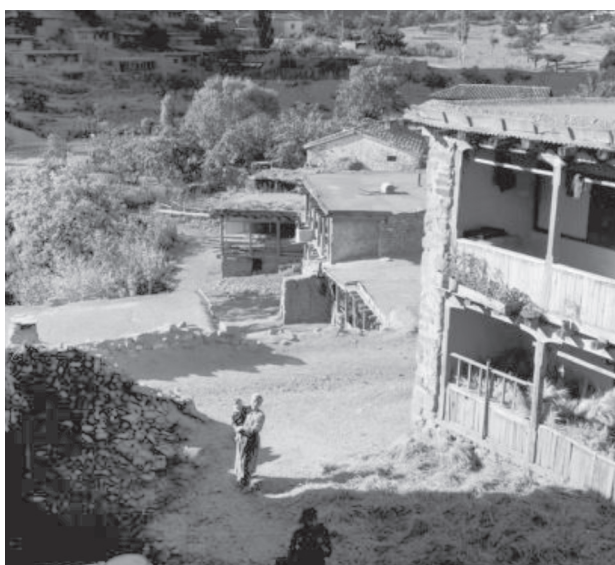
Іл. 2. Архітектура Криму у роки німецької окупації. 1943. (За рік до депортації). Див. сайт: < https://styler.rbc.ua/ukr/zhizn/god-deportatsii-zhili-tatary-krymu-stalinskih-1518359395.html >