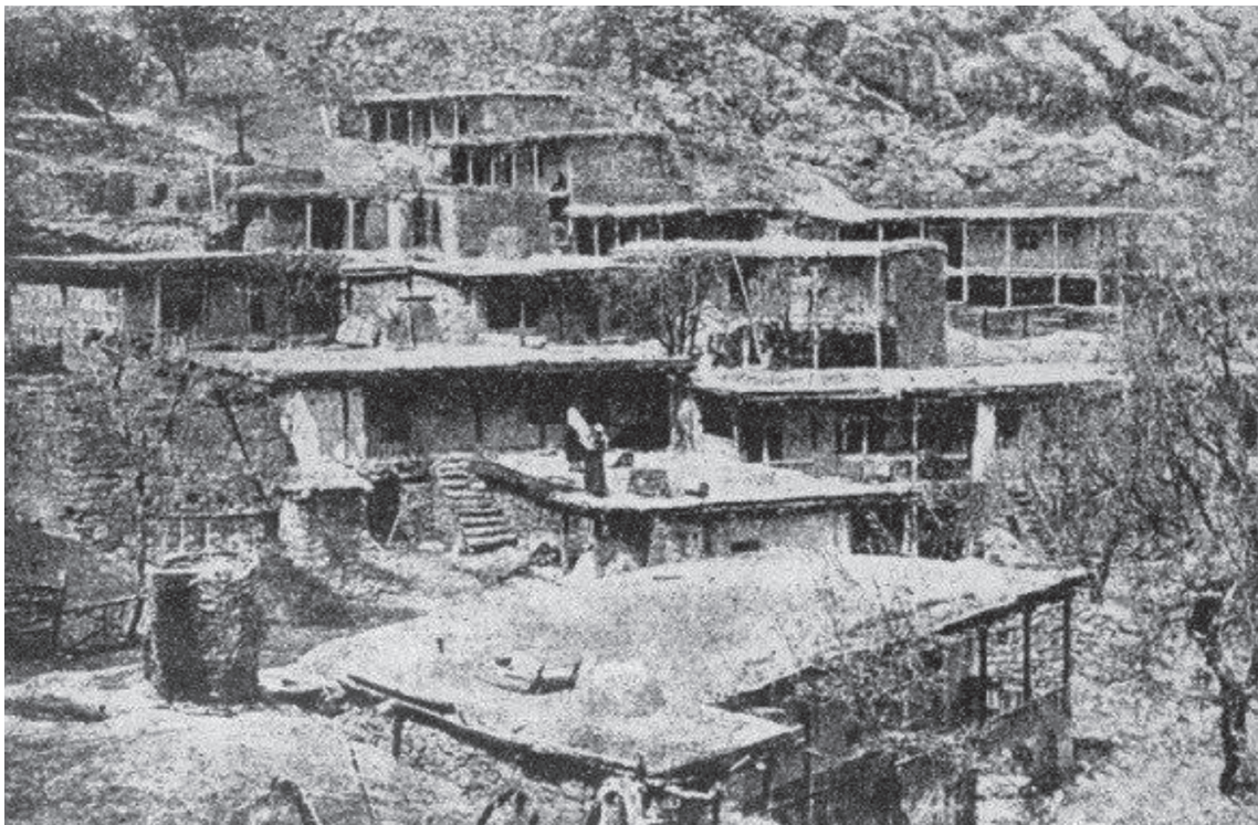
Ил. 1. Житло кримських татар у Шелені — селі гірських татів [тати — давня назва]. (Куфтин Жилище 73)

Дослідження й аналіз шляхом порівняння результатів натурних обстежень і літературних джерел допомогли локалізувати територію поширення кримськотатарської архітектури, розкрити просторові і візуальні зв'язки завдяки методу спрямованості, який передбачає послідовне визначення ролі й місця будинку, ансамблю у міському просторі, а також дали змогу прослідкувати та проаналізувати виникнення й еволюцію типологічно і стилістично однорідних груп архітектурних об'єктів та окремих елементів в їхній хронологічній послідовності.