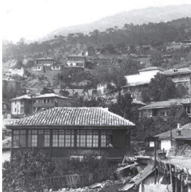
Іл. 4. Архітектура Гурзуфа. Початок ХХ ст. (Старовинні)