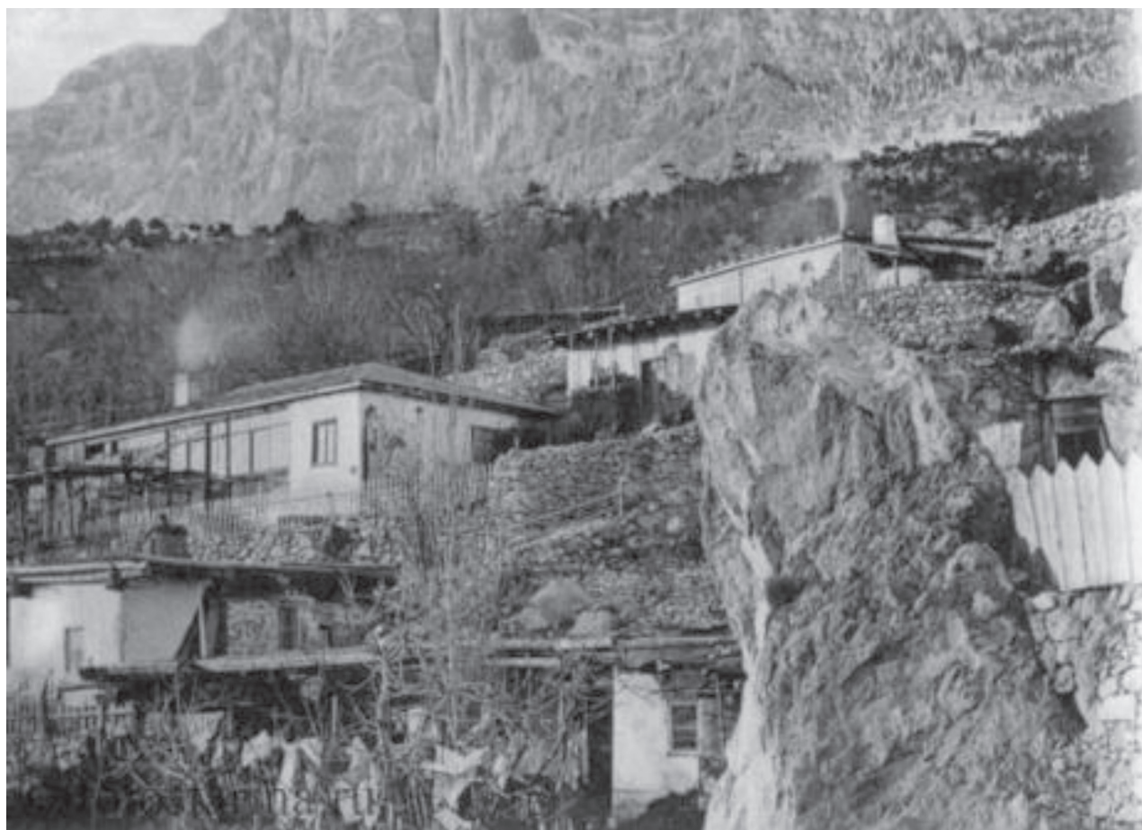
Іл. 3. Кримськотатарське житло у м. Алушка. Початок ХХ ст. (Старовинні) Див. сайт: https://crimeanblog.blogspot.com/2016/04/alupka-foto.html